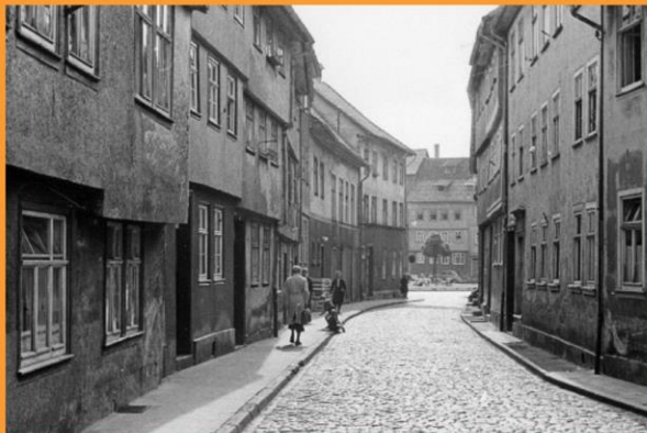
Schmalkalden, 1958