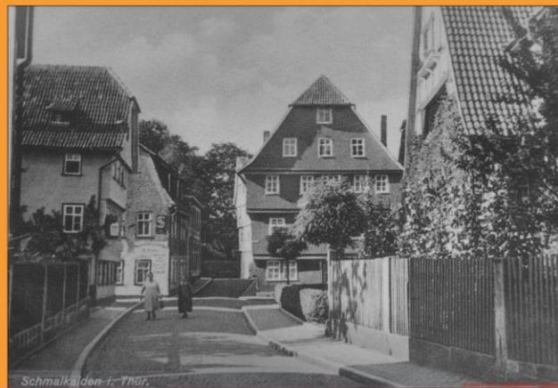
Schmalkalden - 1 - Thür.