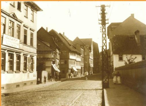
nach 1914