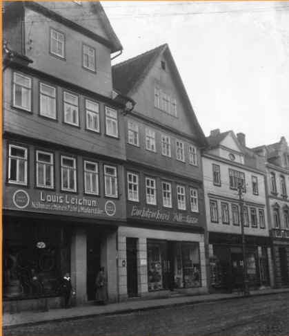
Schmalkalden, um 1920