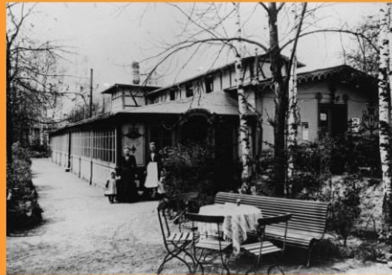
aus: Chronik des Kreiskrankenhauses, 1989 Foto: 1912