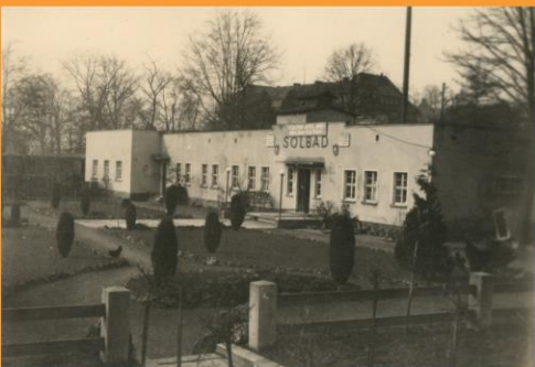
aus: Hans Lohse. Geschichte der Sol- und Mineralquellen Schmalkaldens, 1961