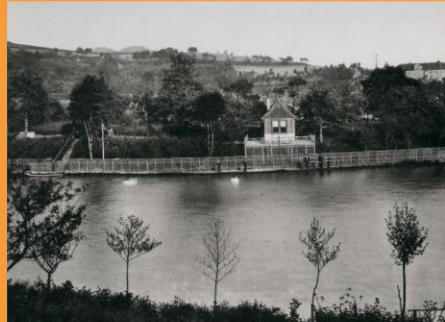
Verlag: Junghanss & Koritzer, Meiningen, 1891